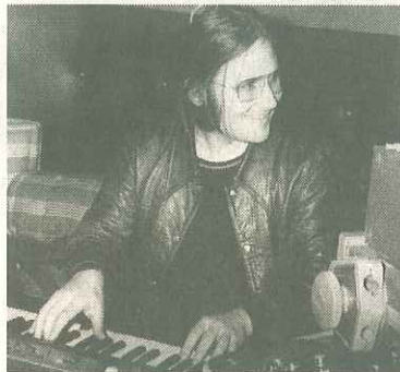
Irmin Schmidt bei „Can“...