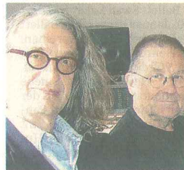
... Wim Wenders.

Sie sind mit Ihrer Band Can sehr früh zur Filmmusik gekommen. Wie kam es dazu?